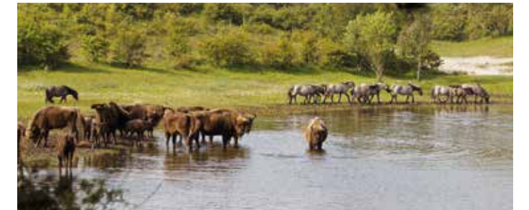
Wisenten en koniks bij het meer van Burdet in het Kraansvlak.

verstuiving. Bovendien zette men diverse soorten grazers in en verwijderde de beheerder de te voedselrijke bovenlaag van oude, dichtgroeide landbouwvallen. Voor een mogelijk gunstig effect op de fauna (vlinders en kevers) is een brede variatie aan grazers aan het werk gezet: van paarden tot schaapskuddes, van geiten tot wisenten. Het Kraansvlak, waar de wisenten leven (een kudde van ruim 20 dieren), is nu opener en kent meer zandige plekken. Wisenten en konikpaarden hebben verdere uitbreiding van houtachtigen (kardinaalsmuts, duindoorn) en verruiging van graslanden in het Kraansvlak afgeremd, maar niet stopgezet. Of begrazing met wisent tot wezenlijk andere vegetaties leidt dan begrazing met hooglanders, is na 10 jaar onderzoek nog de vraag.